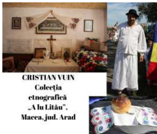
CRISTIAN VUIN Colecția etnografică „A lu Litău”, Macea, jud. Arad

Mărturii ale trecutului strămoșilor măceni... obiecte care astăzi păstrează doar amintirea și parfumul celor care au fost... devin parte a prezentului, devin de o profunzime copleșitoare, păstrând credința strămoșească ținută cu sfințenie de moșii și strămoșii noștri, specificul nostru de viață și cultură