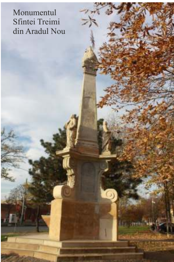
Monumentul Sfintei Treimi din Aradul Nou

În acest context, elementul votiv (promisiunea) făcută lui Dumnezeu, de la care se aștepta îndurare, putere prin credință era și construirea unui monument care în iconografia oficială catolică austriacă și-a găsit consacrarea într-un obelisc sau coloană, ca simbol al razelor solare, așezată pe un soclu trilobat ce susține în vârf imaginea sculptată a Sfintei Treimi,