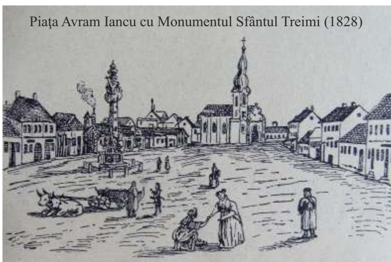
Piața Avram Iancu cu Monumentul Sfântul Treimi (1828)

Conform parabolei lui Iov, în mentalul colectiv se admite atotputernicia divină, proclamându-se fățiș și violent că Dumnezeu este autorul patimilor omenești dar și al suferințelor, că Dumnezeu nu poate fi judecat pentru faptele sale, atâta vreme cât el este atât parte în proces cât și judecător. Pentru a ieși din acest impas, cei în cauză trebuie să rămână neclintiți în credința lor, fiindcă virtutea chiar pusă la încercare, iese întotdeauna biruitoare. În