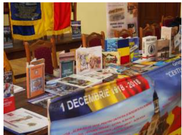
Editura Gutenberg Univers Arad prezentă la Salonul de carte și presă Uzdin