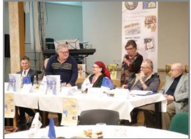
Gala Excelenței 8 Februarie 2020