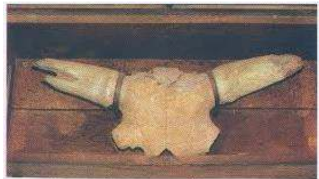
Capul taurului care a descoperit Icoana Maicii Domnului, păstrat la Mănăstirea Hodoș-Bodrog

Băiatul a ascultat de sfatul maicii sale și a pelcat să-și afle meșteri mari, pricepuți, care să vină să facă mănăstirea. După multă umblare și cercetare, a dat peste niște zidari care tocmai atunci au început să șindilească coperișul unei mănăstiri, fiind zidirea gata. Meșterii zidari au plecat cu toții la locul unde era să se zidească mănăstirea.