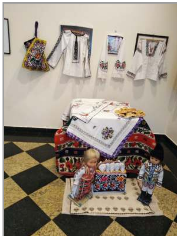
Colecție Bunicuțele din Uzdin, Serbia