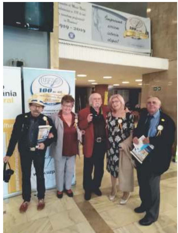
Delegația arădeană la Centenar UZPR